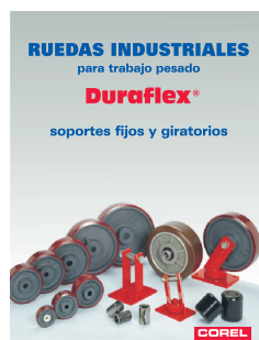
Boletín Técnico No. 40