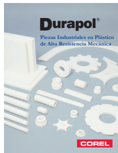
Catálogo Técnico No. 105