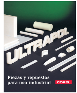
Catálogo Técnico No. 95