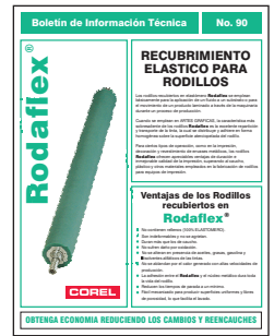
Boletín Técnico No. 90