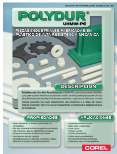
Boletín Técnico No. 80