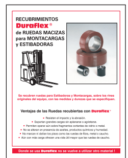
Boletín Técnico No. 50