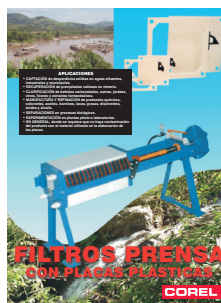
Boletín Técnico No. 70

Fabricados con placas plásticas Durapol® para filtración de líquidos o recuperación de sólidos en procesos químicos, farmacéuticos, de alimentos o en captación de desperdicios sólidos en efluentes industriales o municipales.